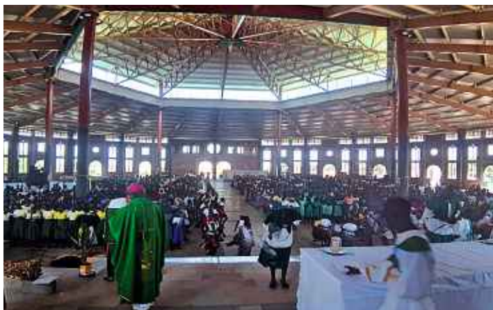
Beeindruckende Erfahrung: Am Jugendgottesdienst in Moroto nahmen rund 2500 Gläubige teil.