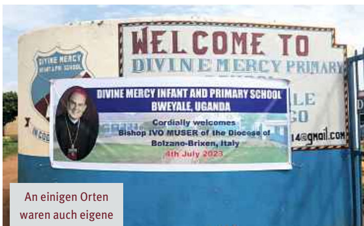
An einigen Orten waren auch eigene Plakate angefertigt worden, um Bischof Ivo Muser willkommen zu heißen.